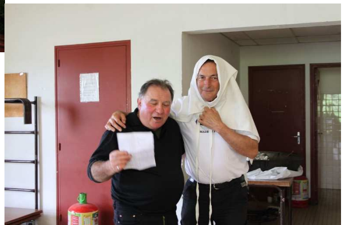
Ogenne Camptor, Jasse, Navarrenx, Méritein,