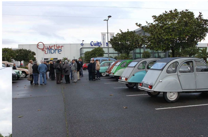
Les voitures prennent la route de Sauvelade passent par l'abbaye de Sauvelade, Bastanès,

Départ à 10h Place du 19-Mars 1962 à Lagor.